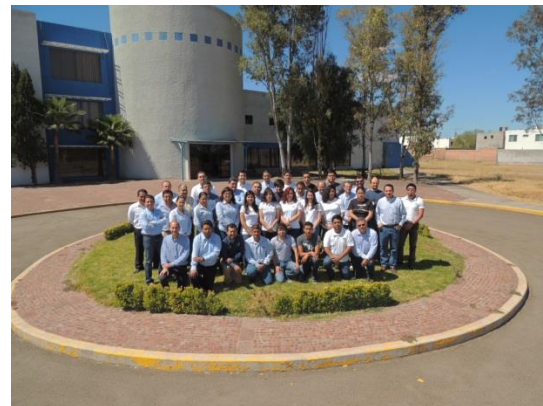
Personal del CIO Unidad Aguascalientes

Departamento de comunicación y difusión de la ciencia